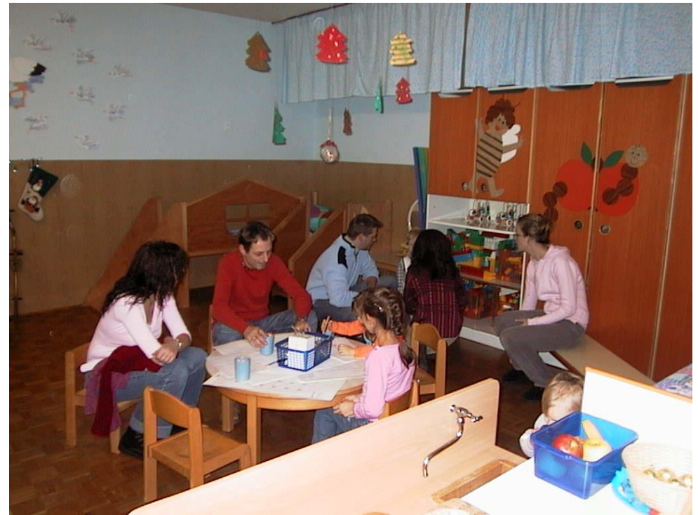
LIKOVNI KOTIČEK - RISANJE