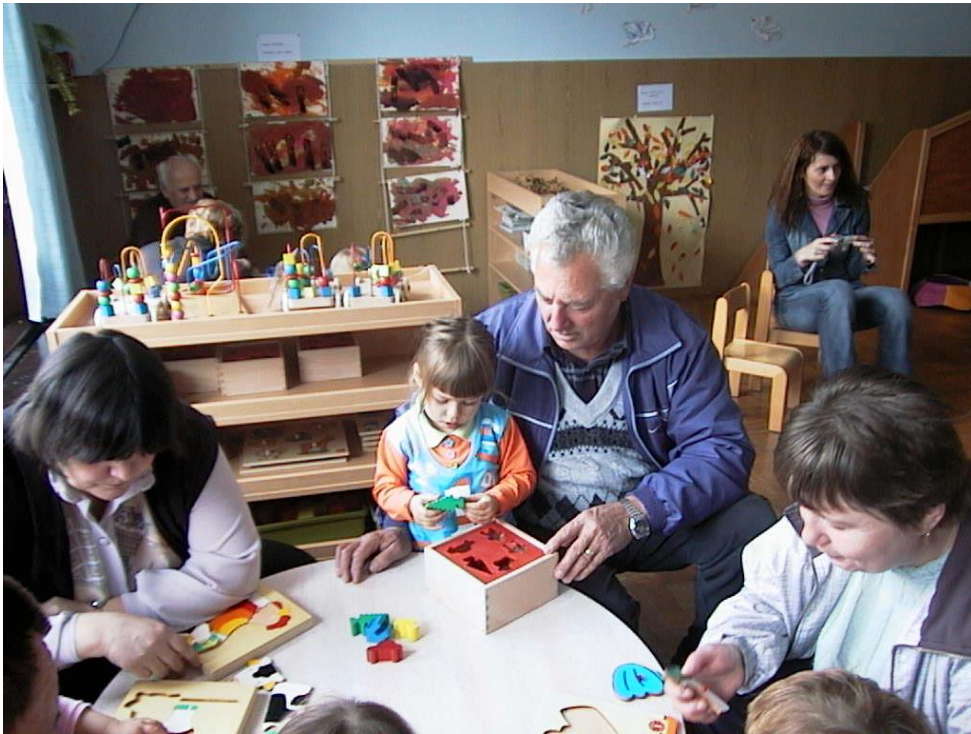
SIMBOLNA IGRA-RAZVRŠČANJE, SESTAVLJANKE